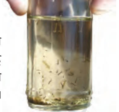
मच्छर के लारवे

रजत – मक्खी तो काटती नहीं है, वह कैसे बीमारी फैलाती होगी?