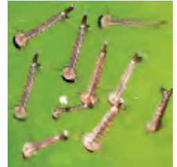
हैंड लेंस से देखने पर लारवे